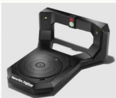
デジタルスキャナーと